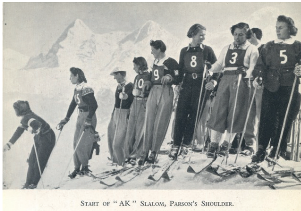
START OF "AK" SLALOM, PARSON'S SHOULDER.